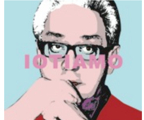
Pierangelo Sequeri (1944)

Da quando Dio osò essere un Volto d'Uomo, è nello sguardo dell'uomo che si accende o si spegne la fonte invisibile di ogni energia dell'affezione, che tiene in vita il mondo. Dato che, a quanto sembra, sappiamo fare tutto, la battaglia ormai è per ciò che non sappiamo fare: lasciar apparire, nei tratti irrimediabilmente inadeguati dei